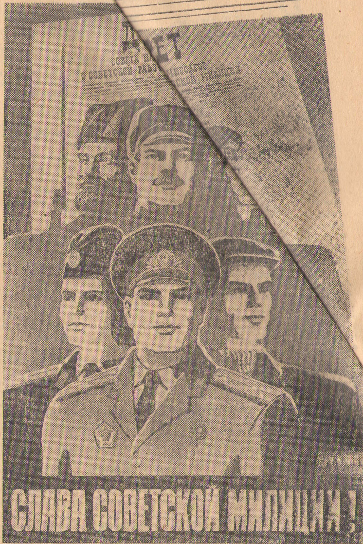
Плакат художника Г. Гаусмана. Издательство «Плакат».

Шестидесятилетний опыт Советского государства говорит о том, что у нас есть все условия, чтобы полностью искоренить преступность и причины, ее порождающие.